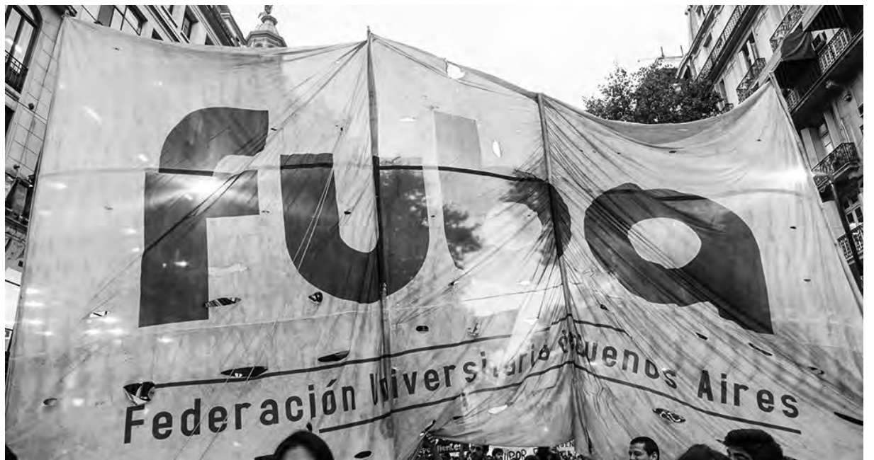
Nuevo Espacio/Franja Morada busca imponerse en la FUBA.

Pese a la histórica movilización del 12 de mayo contra Macri y la gran disposición a enfrentar el ajuste que demostró el movimiento estudiantil durante el conflicto docente, la política de no extender ni desarrollar con asambleas el conflicto por parte de PO, PCR y Patria Grande, tendió a evitar una rebelión estudiantil por el presupuesto y el boleto educativo gratuito. Se sigue manteniendo una política desmovilizadora y moderada dentro de las organizaciones estudiantiles permitiendo que las corrientes patronales aliadas o cómplices del ajuste macrista se sostengan e incluso incrementen sus votaciones, brindando servicios y centros de gestión al estudiantado. Ésta es la causa de fondo por la cual en las próximas elecciones en Arquitectura y en Psicología, Nuevo Espacio/