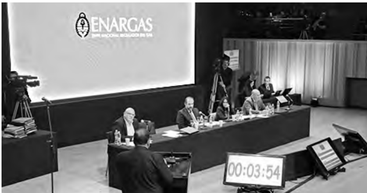
Vista de la audiencia en la Usina del Arte

En Córdoba, de 200 anotados solo quedaron 20, muchos de ellos desconocidos. Después de duros