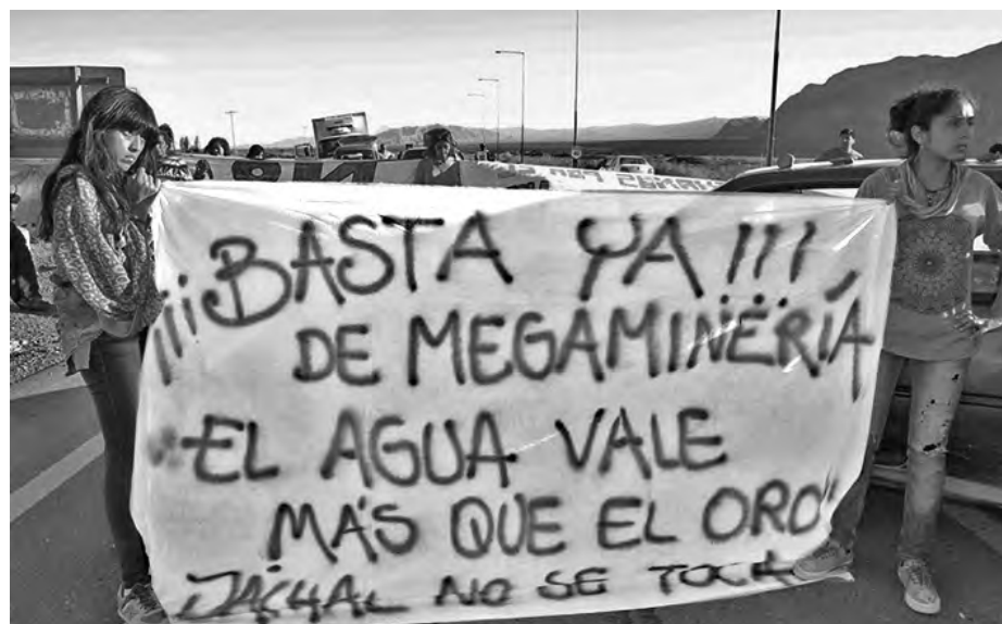
¡Fuera la Barrick!

No alcanza con una multa o suspender la actividad por unos días. El pueblo de Jáchal e Iglesias, como toda la población de San Juan, no puede seguir tolerando que envenenen su futuro mientras las multinacionales saquean nuestros recursos. Al pueblo no le alcanza para comprar agua mineral, sabe que está tomando metales pesados como indican los últimos análisis en los que se remarca que el agua no es apta para consumo humano ni animal por sobrepasar