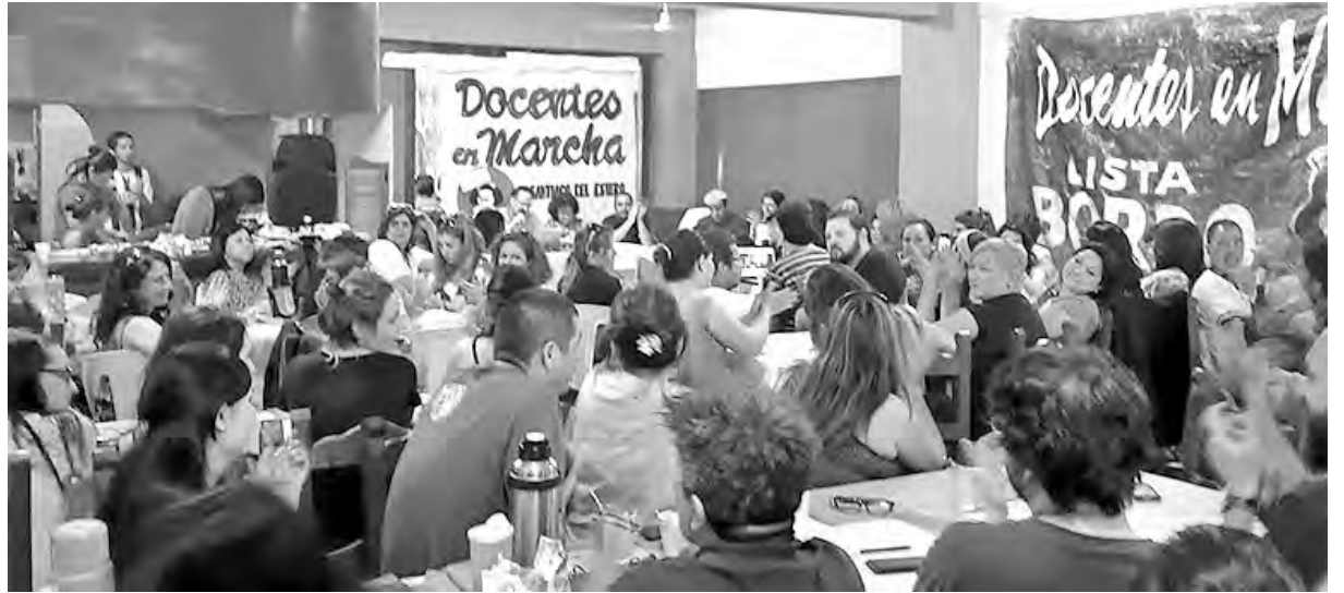
Vista del Encuentro

A la tarde se realizaron comisiones temáticas en dos hoteles más, con mucho debate: Reforma Educativa y Evaluación Externa, Operativo Aprender; rol de la escuela y con-