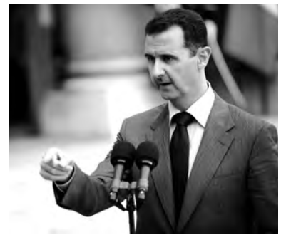
Dictador Bashar Al Asad

Por desgracia, no parece que nadie sea lo suficientemente consciente del peligro de esta realidad. Muchos, especialmente en Occidente, prefieren esconderse tras teorías fatalistas que tratan de dar explicaciones en base a la religión, la cultura, o el cambio climático. Pero esto empeora