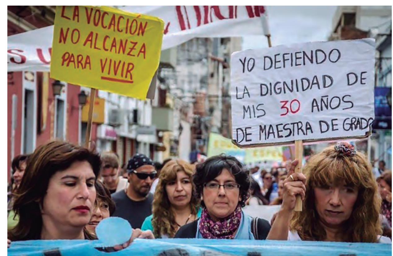
Paran los docentes y marchan los bancarios