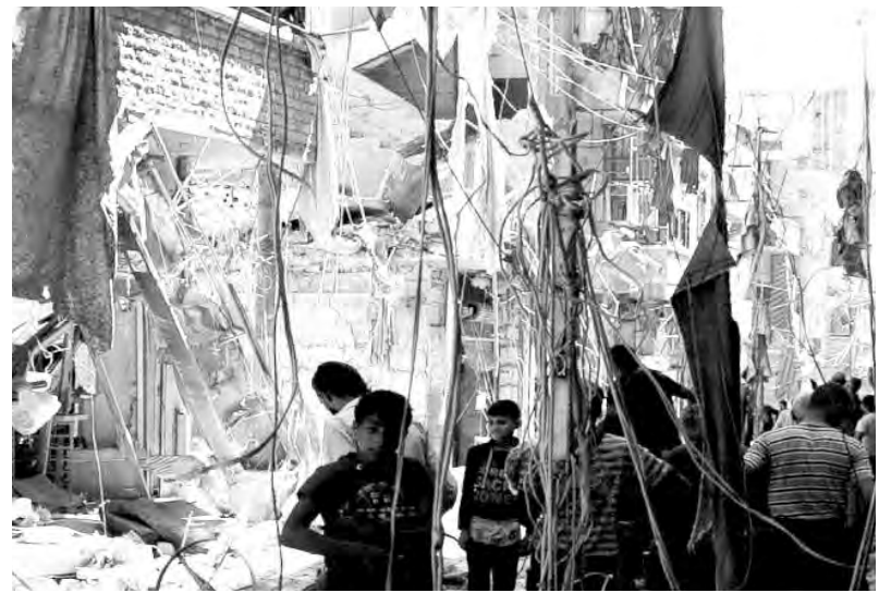
Bombardeos en Alepo

Como intelectuales sirios -escritores, artistas y periodistas- vemos que el mundo entero hoy se dirige hacia una decadencia moral sin precedentes, en la que aumentan los niveles de miedo y odio, al mismo ritmo al que suben las acciones de los políticos que invierten en el miedo, el odio y el aislacionismo. Además vemos que la democracia está en retroceso en todos los rincones del mundo, mientras que la vigilancia, las restricciones y el miedo no dejan de aumentar y extenderse. No creemos que se trate de algo inevitable, sino que se trata de opciones peligrosas elegidas por